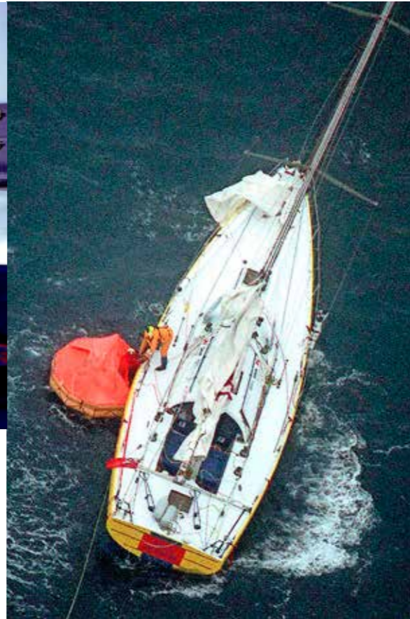
PETE GOSS /DPPI