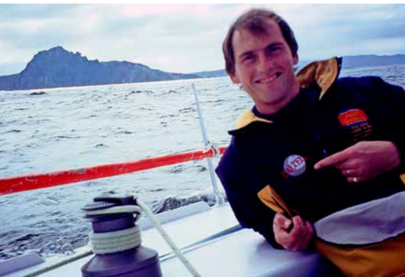
Het rond van Kaap Hoorn.