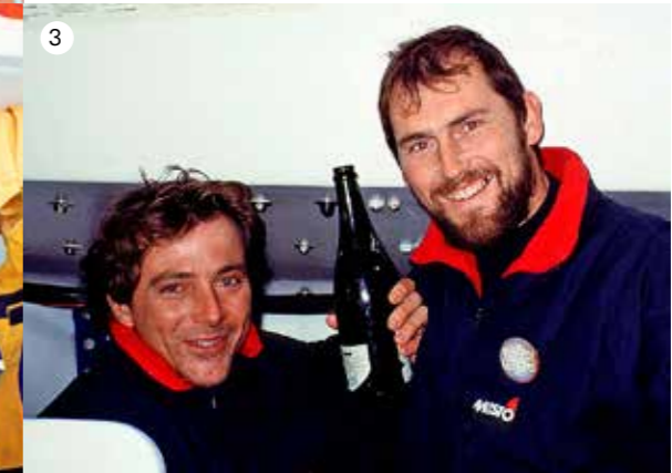
PETE GOSS /DPPI