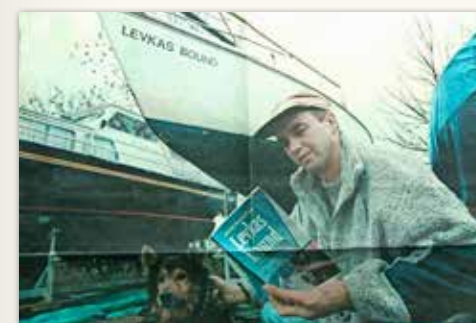
▲▲ Zwemmen met hond Lex.