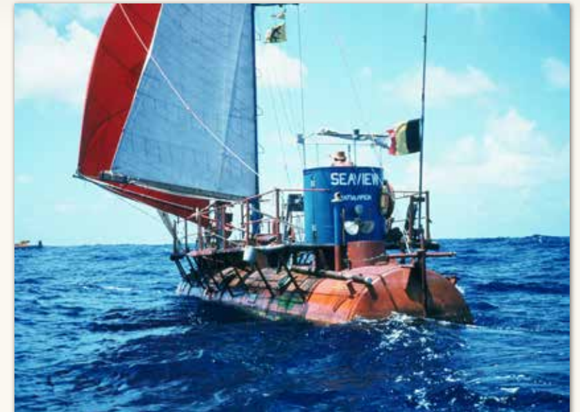
◀◀ Zeewaterdouche. ◀ Ombouwde stoomketel Seaview .