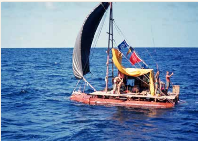
Het vlot De Laatste Generatie .

Een ander avontuur beleeft Oerlemans met een bijzondere constructie die hij bouwt van een oude stoomketel die hij op de kop heeft getikt. Hij last een kiel met behuizing eronder en monteert ramen onder water. Lampen uit het landingsgestel van een vliegtuig moeten de onderwereld verlichten: "Het was een prachtig vaartuig." Lachend: "Het was ook het langzaamste schip dat ooit gebouwd is, denk ik," doelend op de topsnelheid van 3 knopen. "Dat maakte allemaal niet uit. We hebben ontzettend veel tijd doorgebracht in het onderwatergedeelte, waar we de Atlantische flora en fauna prachtig in de gaten konden houden." Zo mooi als Seaview haar onderwaterwereld toont, zo slecht zeilt ze. Kee vertelt in hun boek, Zes keer is genoeg :