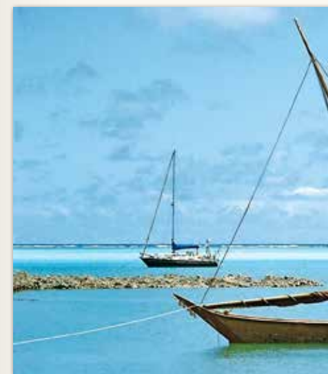
"Die verhalen van mensen die naar de Aleoeten voeren, vond ik altijd al fascinerend."