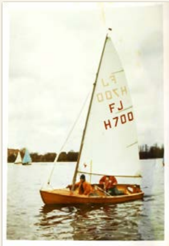
De Flying Junior met eigengemaakt zeil