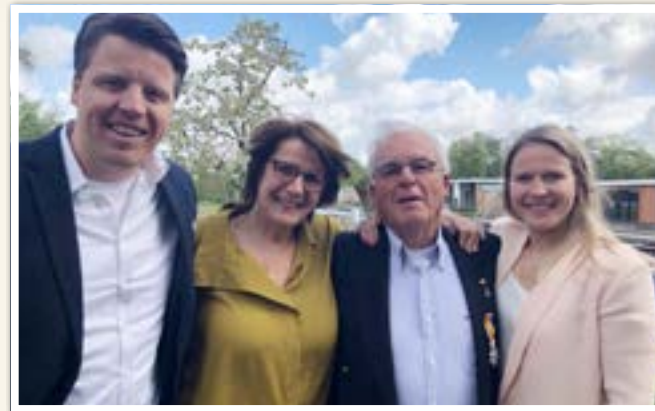
Lintje pa Familiefoto

Bijzondere zeilprestaties zijn niet alleen voorbehouden aan mensen uit de categorie Bekende Nederlanders. Zeilen belicht een aantal van die vergeten zeilers onder de noemer 'Onbekende beroemdheden'.