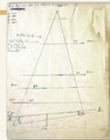
De maten voor Heineke's eerst zeiltje

Het eerste "bij elkaar gescharrelde" bootje van de jonge Martin Heineke was een Flying Junior, ook wel FJ genoemd. Lengte over alles 4,03 m, Breedte 1,50 m, Diepgang 1,10 m, Rompmateriaal hout, Grootzeil 7,3 m 2 , Waterverplaatsing 75 kg, Bemanning 2 personen. De eerste exemplaren hadden een rood zeil, om de bootjes gemakkelijk te kunnen waarnemen op het water.