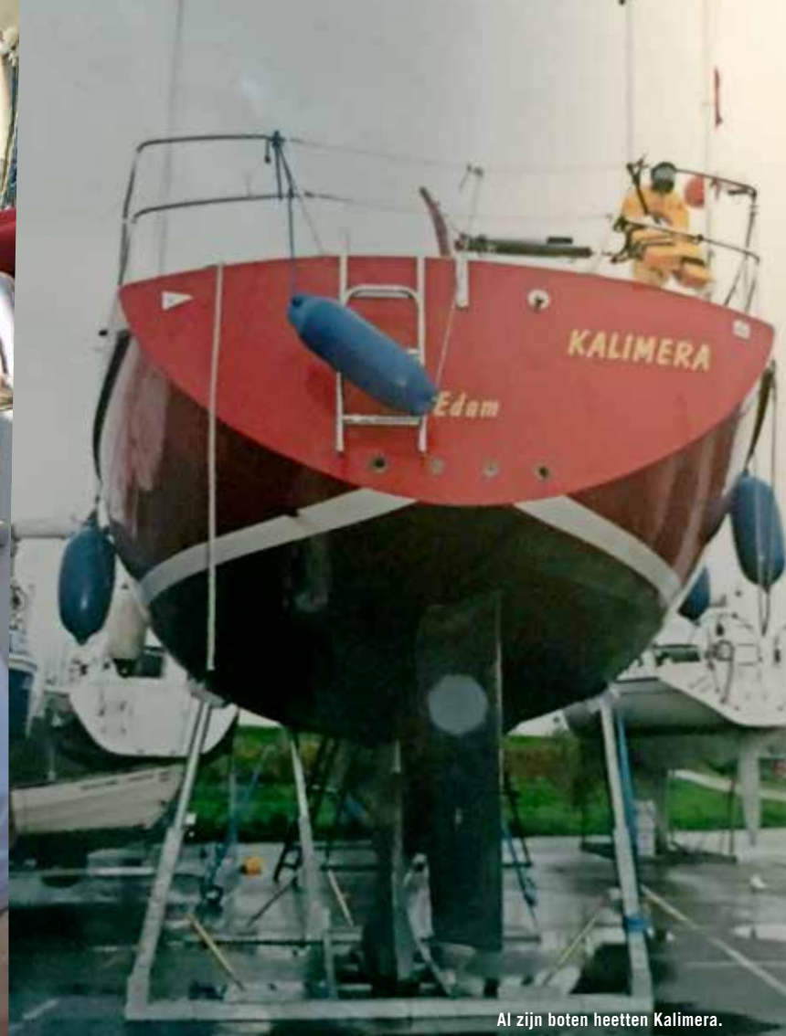
Al zijn boten heetten Kalimera.

“Ik denk dat hij de 24 Uurs Zeilrace 46 keer gevaren heeft”