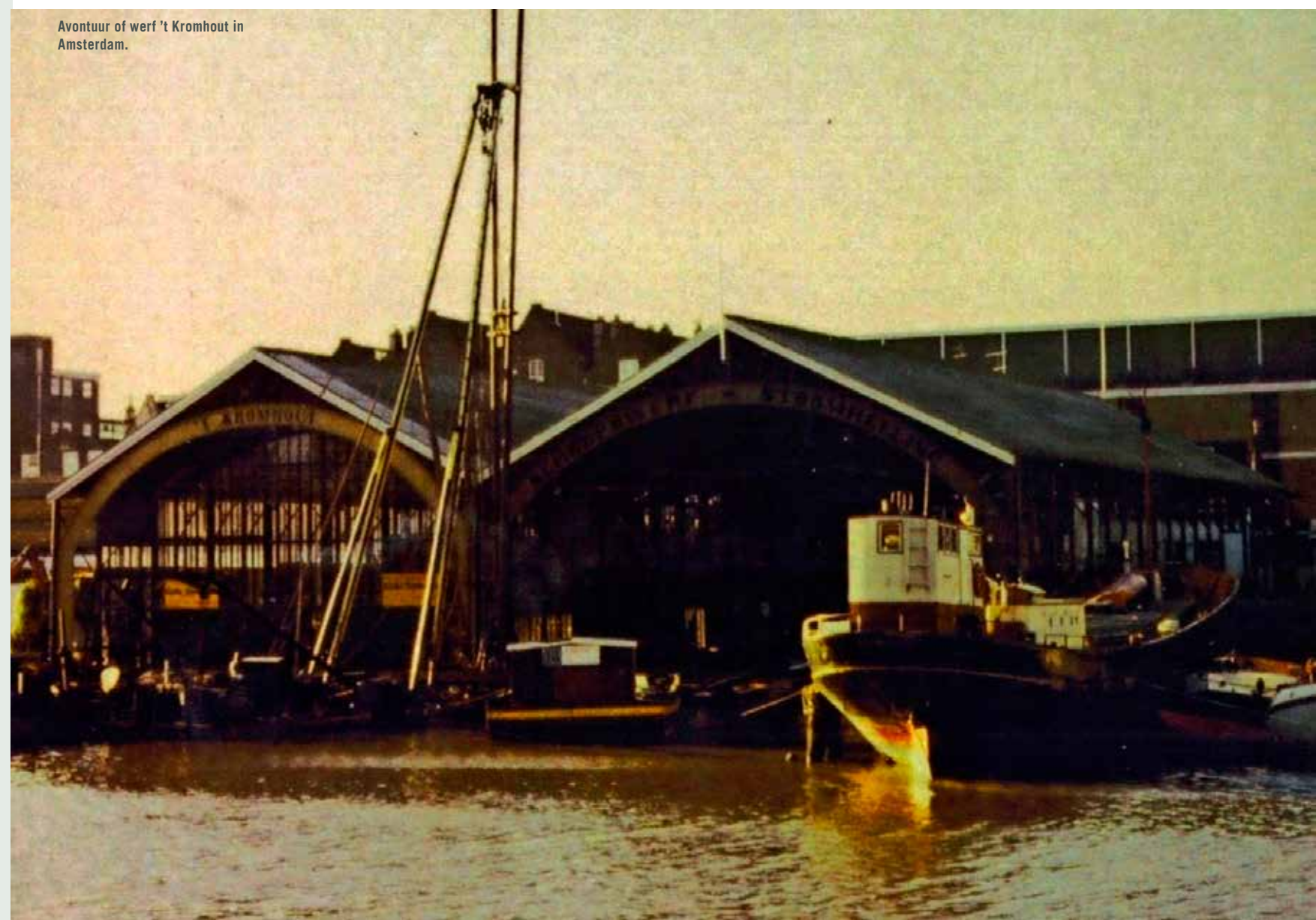
Avontuur of werf 't Kromhout in Amsterdam.