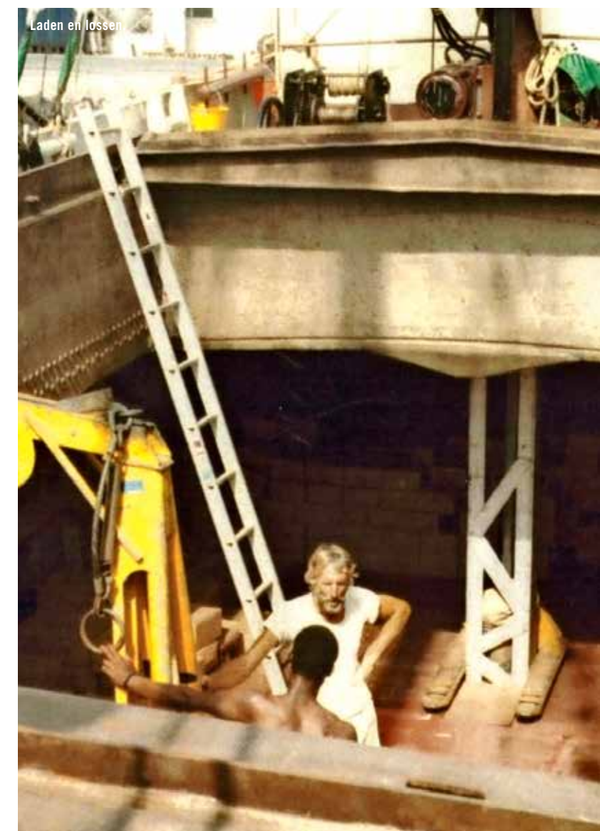
Laden en lossen