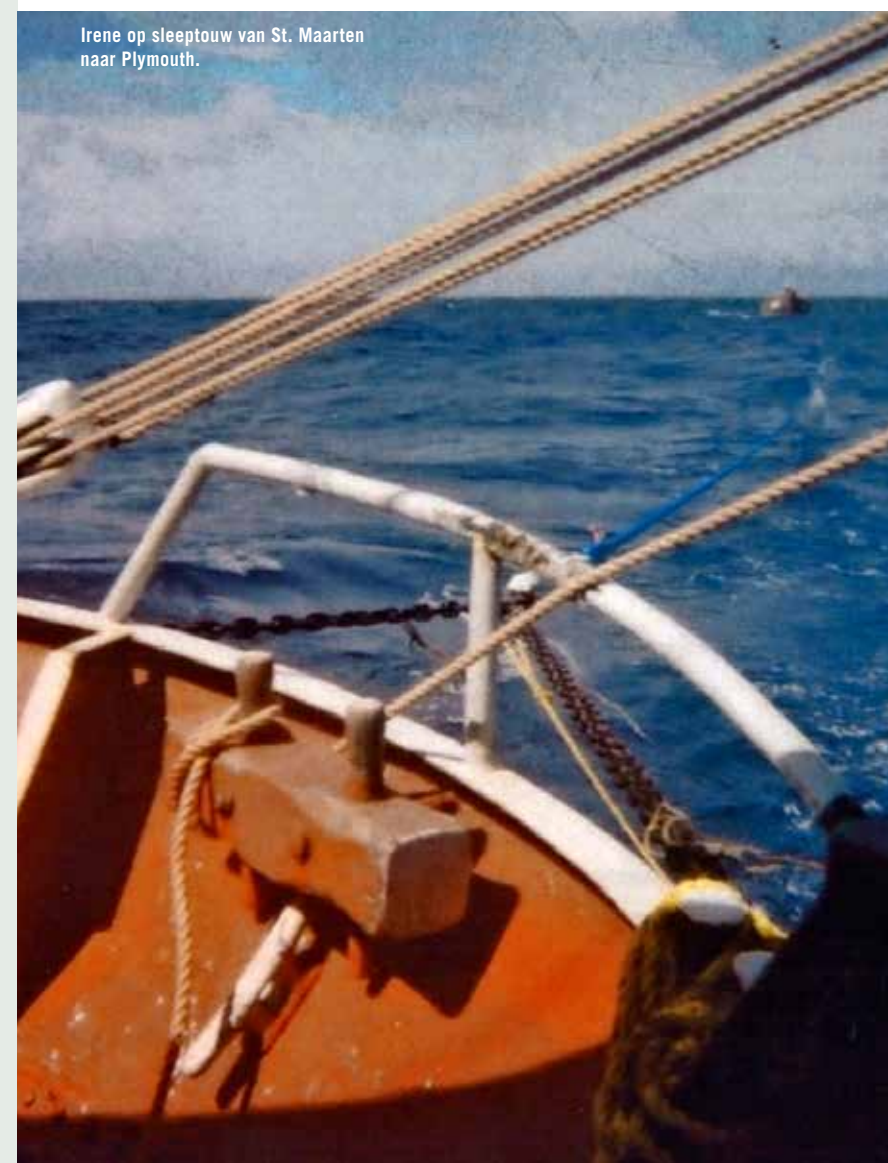
Irene op sleeptouw van St. Maarten naar Plymouth.

“Hij wilde al vroeg naar zee. Toen hij de kans kreeg, deed hij dat direct”