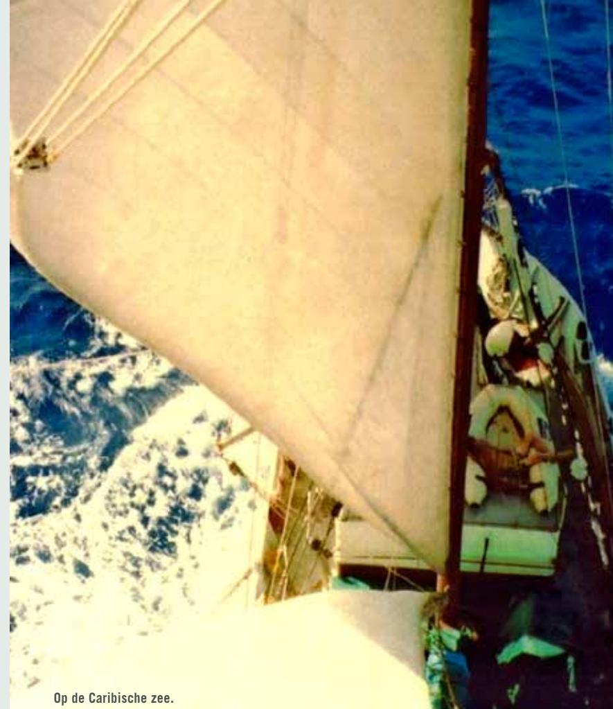
Op de Caribische zee.