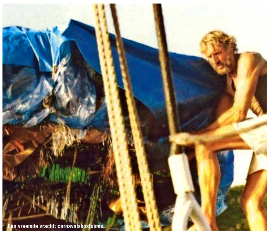
Een vreemde vracht: carnavalskostuums.