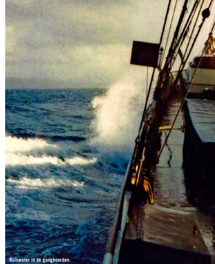
Buiswater in de gangboorden.