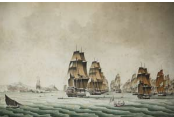
Boven: zicht op Portoferraio met boven in het midden Napoleons Villa dei Mulini (geel) en rechtsboven het Forte di Stella; onder: schepen voor de haven van Portoferraio in de napoleontische tijd. Rechterpagina, links: de Waterpoort; onder: uitzicht vanuit de lift naar de top van de Monte Capanne.

houd me in. Dat lijkt niet te gelden voor de eigenaren van de schepen die hier liggen. Het ene jacht is nog groter en luxer dan het andere. Halverwege de boulevard staat een grote poort, de Waterpoort. Pal hiervoor legde de Undaunted aan op 4 mei 1814, om de loopplank uit te leggen voor de destijds beroemdste man van de wereld. Rijen leden van de Nationale Garde van Elba stonden hem op te wachten, met daarachter drommen eilandbewoners die hun nieuwe keizer met eigen ogen wilden zien. Voor ons is de oude Waterpoort de toegang tot het tegen de berg oplopende stadje Portoferraio en enkele musea gewijd aan Napoleon. Elba is eigenlijk een berg die uit het water oprijst, de dorpjes zijn ertegenaan geplakt. Wie de buurt hier wil verkennen moet bereid zijn steile trappen te trotseren.