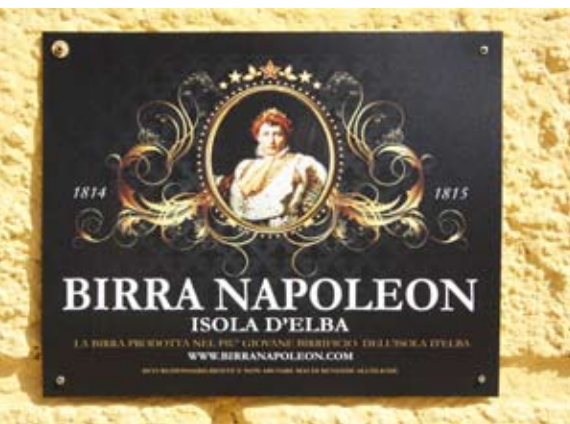
Boven: oud en nieuw in de haven; onder: overal op het eiland kom je Napoleon tegen. Rechterpagina, onder: de kleren van de keizer in de Chiesa della Misericordia.

ruimte. Wie grote protserige kamers verwacht komt bedrogen uit: alle kamers zijn vrij eenvoudig ingericht en in elk geval niet groot. Dat geldt voor de zitkamer, de werkkamer, zijn slaapkamer en de bibliotheek met rijen bruin gebonden boeken – Napoleon was een fervent lezer. De tuin is wel iets bijzonders. Die grenst aan het slaapkamerraam en het uitzicht dat Napoleon bij het ontwaken had is nog hetzelfde als nu: een mooi ingerichte tuin, maar vooral de zee en verderop de westkust van Toscane schitteren.