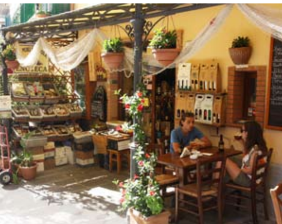
Boven: een oude kaart van Elba; onder: kleine winkeltjes verkopen lokale specialiteiten.

Vigilanti. Napoleon wilde een theater op het eiland en liet dat bouwen aan de Piazza Antonio Gramsci in Portoferraio. Daartoe moest wel eerst de 17de-eeuwse kerk die daar stond uit de weg worden geruimd. De keizer had blijkbaar zo zijn eigen kijk op het nut van kerken. Hij had nu een theater op loopafstand van zijn woonhuis en bezocht er dans- en muziekuitvoeringen. De 65 loges waren bedoeld voor de rijke burgerij. Die wist niet hoe snel ze haar plaatsen moest inkopen, ten gunste van haar status op het eiland. Het theater was dan ook een onmiddellijk succes. Het staat er nog steeds, met zijn schitterende interieur. Vanbuiten is het een onopvallend gebouw, vooral de ernaast gelegen Teatro Bistro Wine Bar verraaft de aanwezigheid van het theater, dat na een lange tijd van verval en renovatie nu weer als zodanig functioneert. Aan het eind van ons verblijf in Portoferraio bezoeken we nog het Misericordia Museum. Het is minuscuul, maar zeer de moeite waard. Hier zijn enkele persoonlijke napoleontische relikwieën aanwezig, zoals het beroemde dodenmasker van de keizer. Ik zie dat hij een beetje een haakneus had. Als ik voor de vitrine sta met een van zijn beroemde kostuums krijg ik een goed idee van zijn gestalte. Er staat ook een stoel waar hij op gezeten heeft;