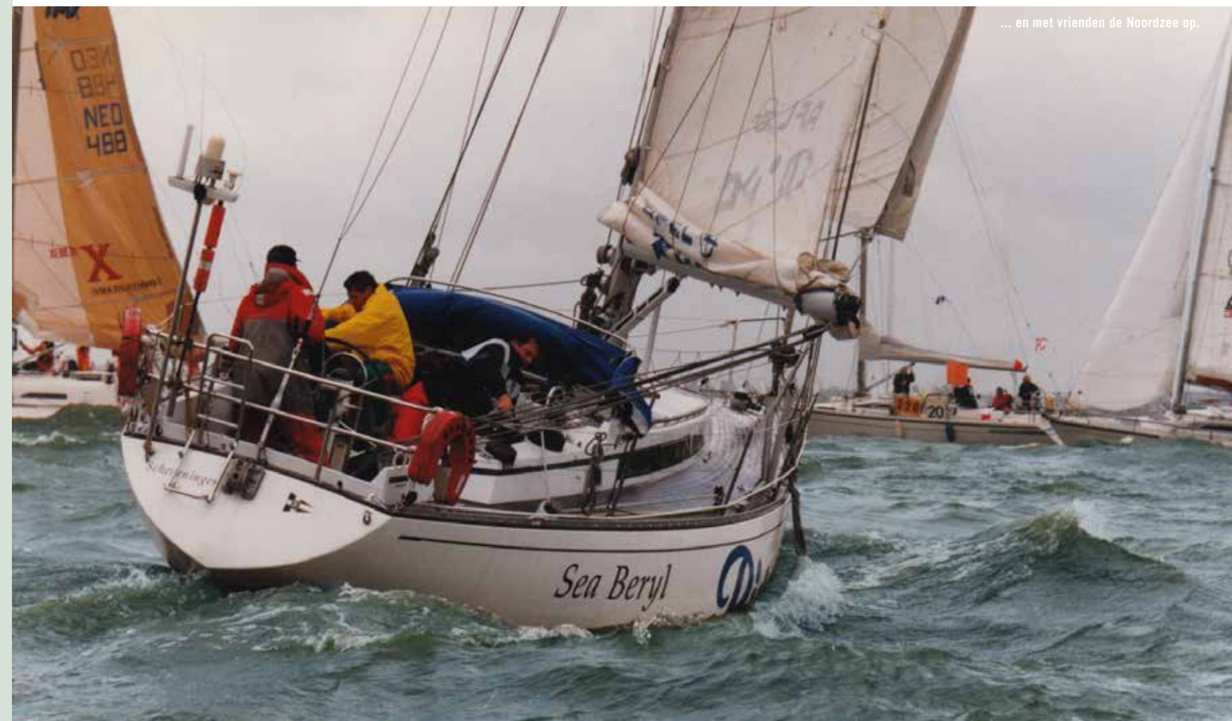
... en met vrienden de Noordzee op.