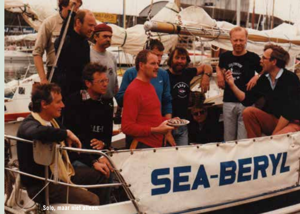
Solo, maar niet alleen.