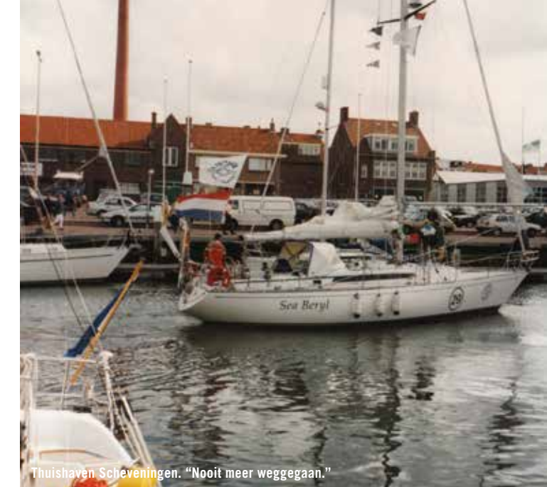
Thuishaven Scheveningen. “Nooit meer weggegaan.”