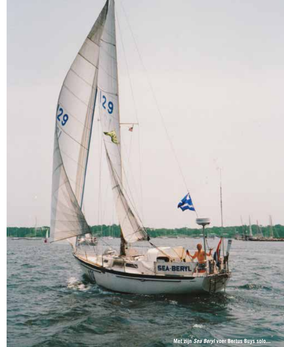
Met zijn Sea Beryl voer Bertus Buys solo...