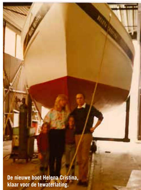
De nieuwe boot Helena Cristina, klaar voor de tewaterlating.