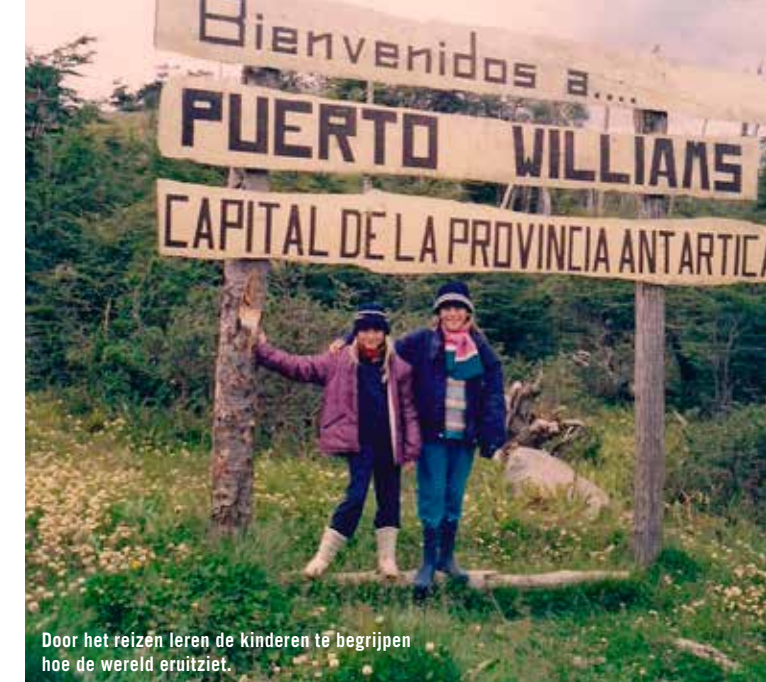
Door het reizen leren de kinderen te begrijpen hoe de wereld eruit ziet.