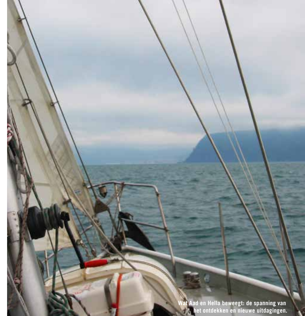
Wat Aad en Hella beweegt: de spanning van het ontdekken en nieuwe uitdagingen.