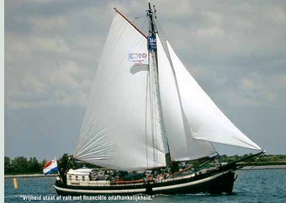
“Vrijheid staat of valt met financiële onafhankelijkheid.”