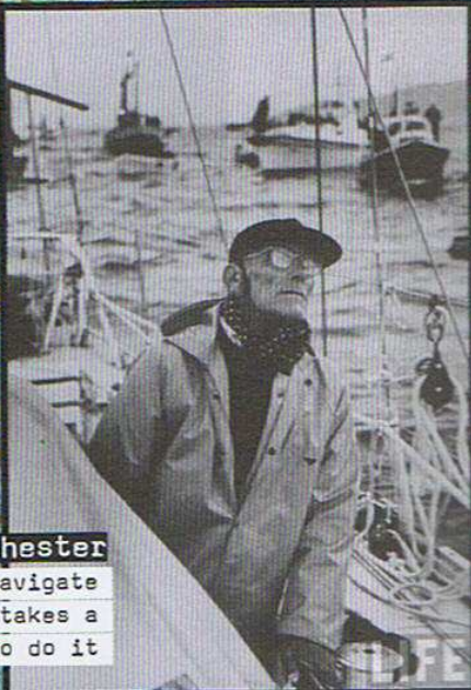
Sir Francis Chichester

"Een niet te beschrijven gevoel van genade"