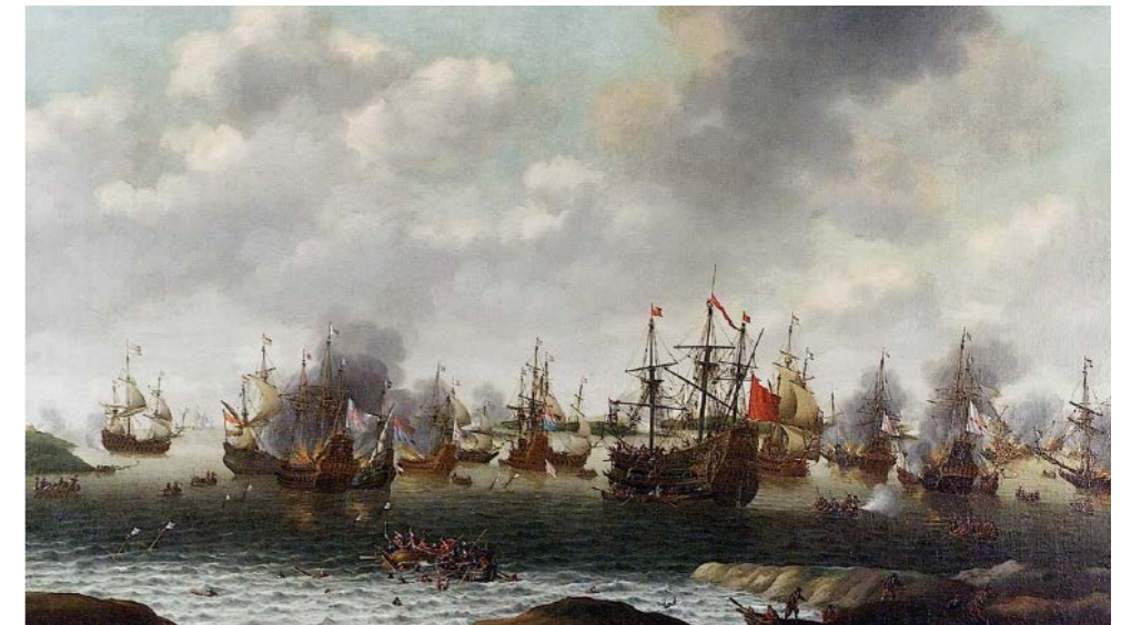
In 1667 schilderde Pieter Cornelisz van Soest dit tafereel over het veroveren van de Royal Charles

D e zeehelden uit ons roemrijke verleden waren meestal geen lieverdjes. Denk bijvoorbeeld aan Jan Pieterszoon Coen, die op een zeer gewelddadige manier huishield in de Indische archipel. Maar wat zegt de drieste aanval op de Engelse vloot in Chatham, nu precies 350 jaar geleden, eigenlijk over De Ruyter? Hoe goed was hij eigenlijk als zeeman? Het had op veel momenten mis kunnen gaan. Heeft hij bij die exercitie enorm veel geluk gehad, of is zijn heldendom terecht? En hoe was hij als persoon? Had ook hij zijn duistere kant? Schrijver en predikant Gerard Brandt was een tijdgenoot van Michiel de Ruyter. In 1687 schreef hij het lijvige boek Het leven en bedrijf van Michiel de Ruyter . De moderne, hertaalde