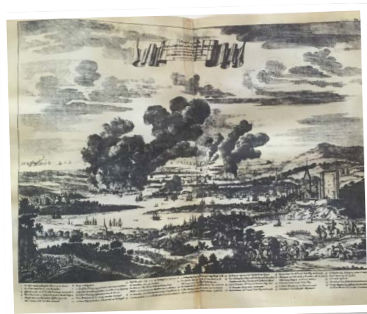
linksonder: Ets uit de biografie door Gerard Brandt met de Medway in vlammen