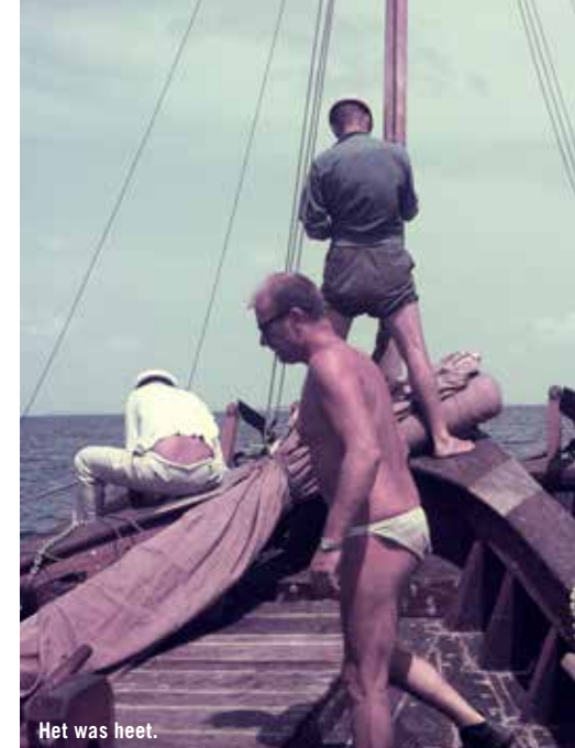
Het was heet.