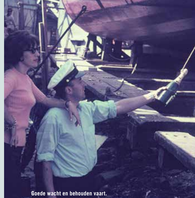
Goede wacht en behouden vaart.

Een Jonk is een vergrote sampan, een vlak en breed zeilschip zonder kiel. Het voert een jonktuig, langsscheeps, met zellatten van bamboe. Lengte: 22 m Diepgang: 1,50 m Waterverplaatsing: 48 ton Tuig: 3 masten met jonktuig Materiaal: hardhout