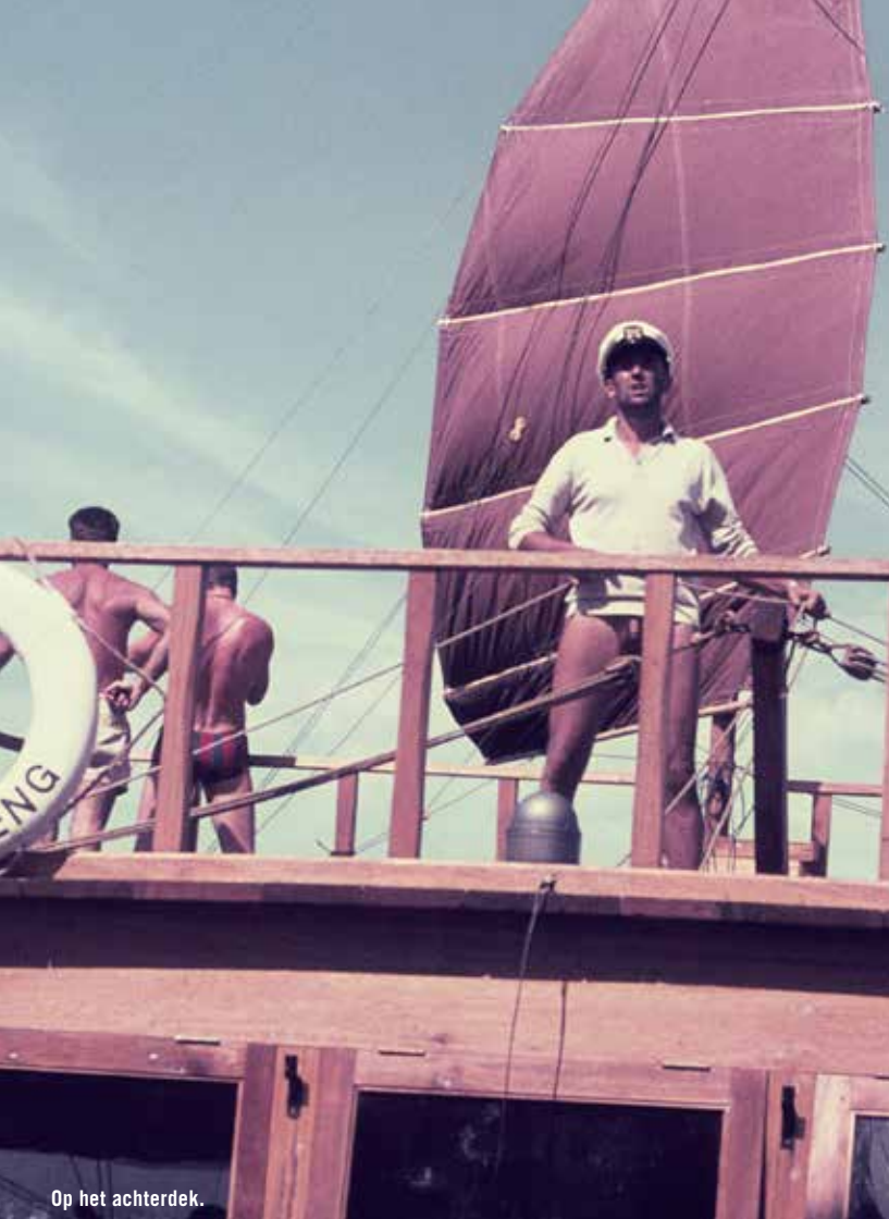
Op het achterdek.