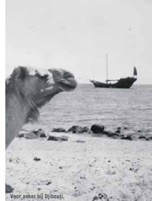
Voor anker bij Djibouti.