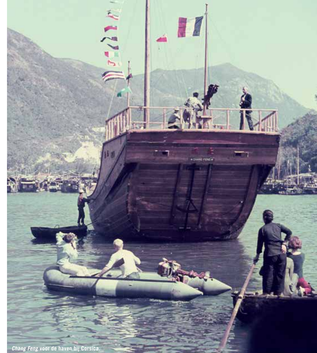
Chang Feng voor de haven bij Corsica.