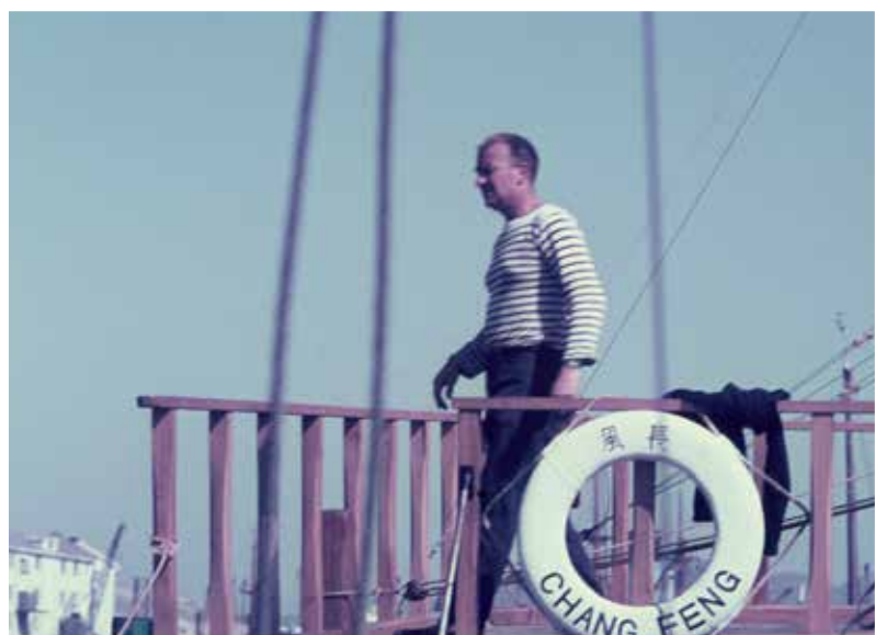
In de haven van Bastia op Corsica.

“De Fransen werden niet gehinderd door enige nautische kennis”