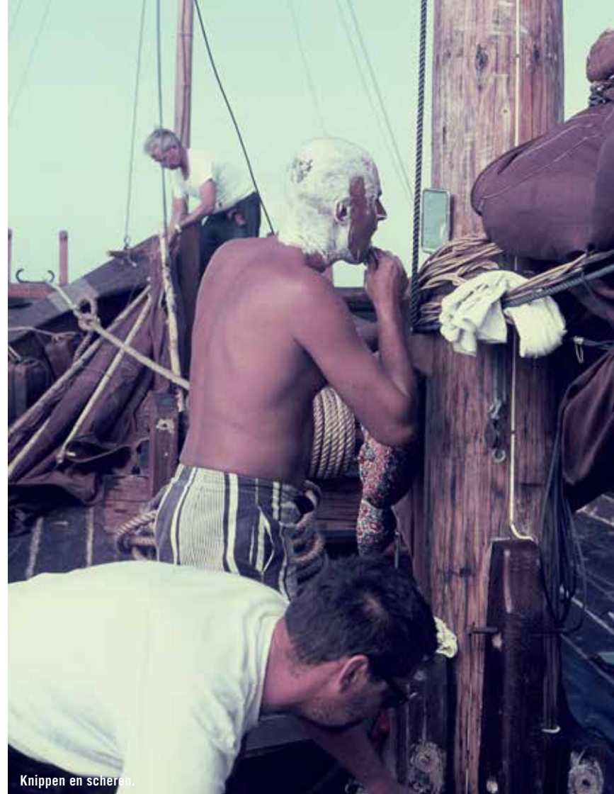
Knippen en scherpen.